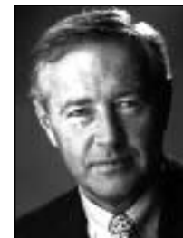
Dieter Pützhofen Oberbürgermeister