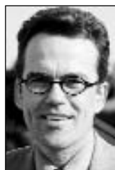
Gregor Kathstede Bürgermeister